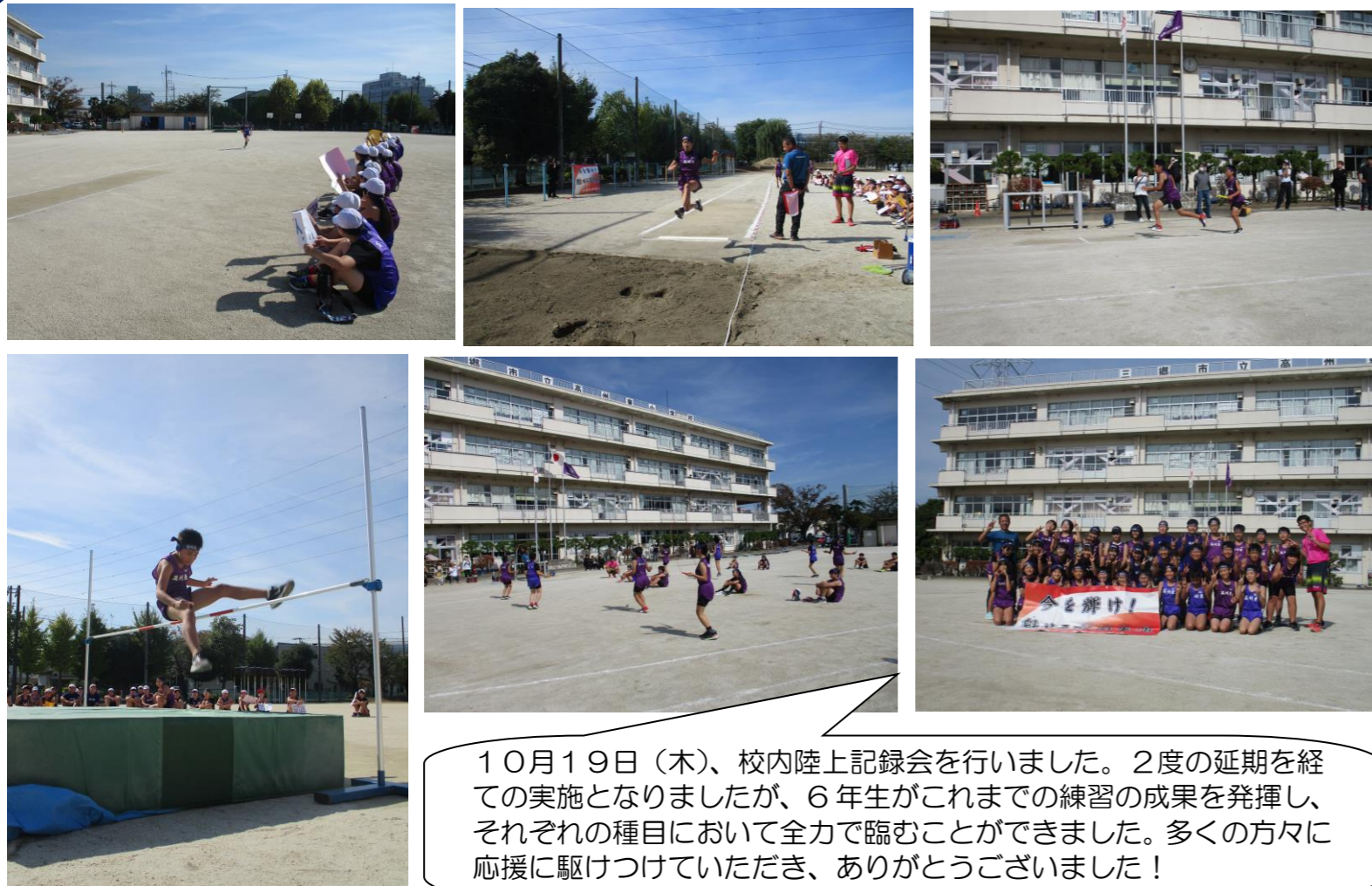
10月19日(木)、校内陸上記録会を行いました。2度の延期を経ての実施となりましたが、6年生がこれまでの練習の成果を発揮し、それぞれの種目において全力で臨むことができました。多くの方々に応援に駆けつけていただき、ありがとうございました!