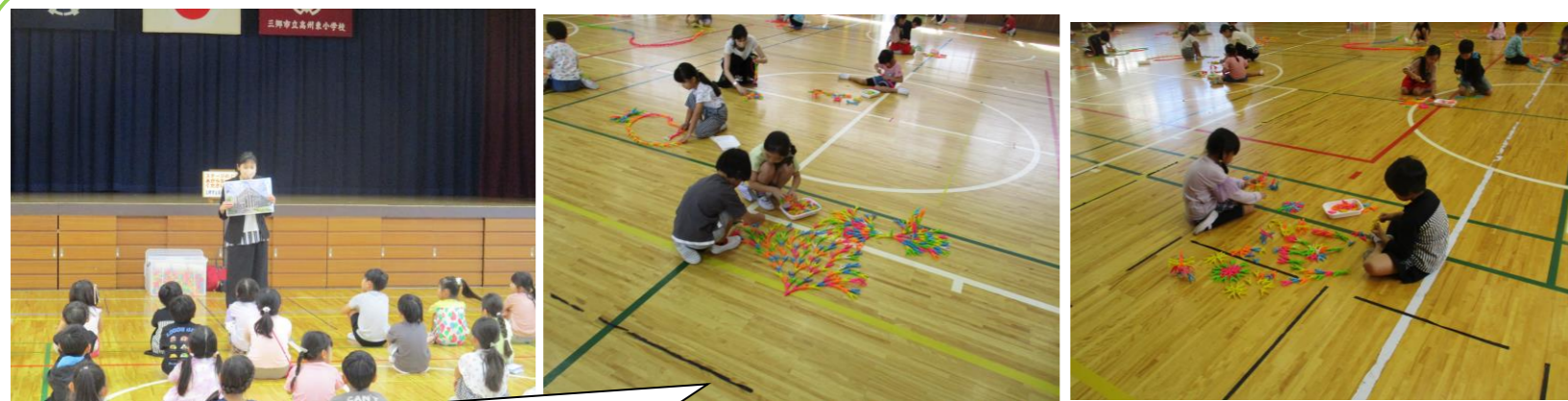
県立近代美術館の方を講師に、1年生が図工の出前授業を行いました。約2万個の洗濯ばさみを自由に使い、思いのままに作品をつくっていました。体育館いっぱいに、カラフルな作品が出来上がりました。