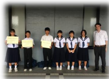
大会に出場した生徒