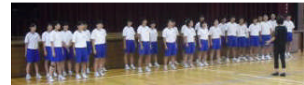
学年の前で手本を示す各クラスパートリーダー