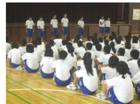
実行委員・指揮者 伴奏者が意気込み を語りました (第1回学年練習)