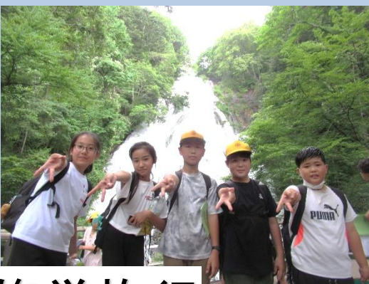
6年生 林間修学旅行