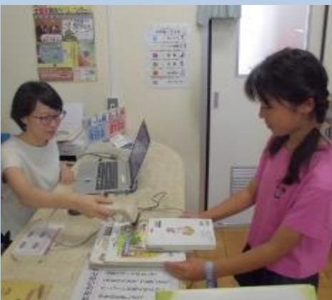
夏休み図書館開放

5年度合計 10.637 冊 7,8月貸し出し 3.432 冊 読み聞かせ 3 件 レファレンス 37 件 その他支援 8 件