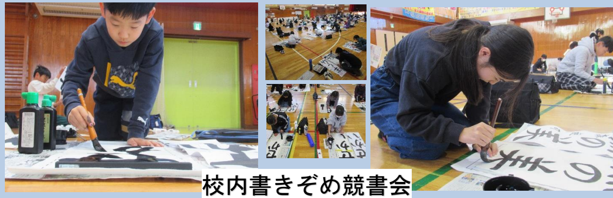
校内書きぞめ競書会