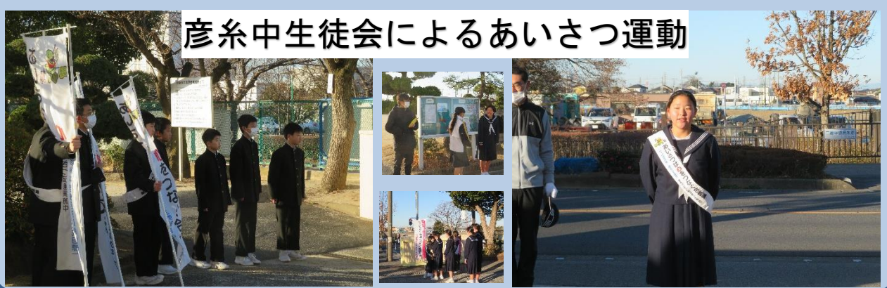
彦系中生徒会によるあいさつ運動