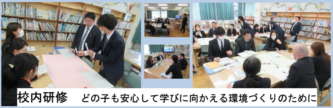
校内研修 どの子も安心して学びに向かえる環境づくりのために