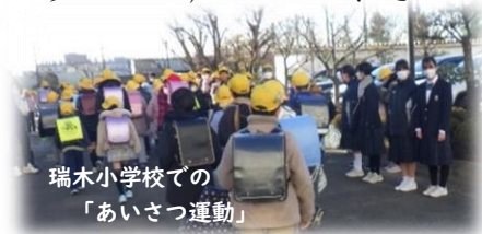
瑞穂小学校での「あいさつ運動」

そして朝の「あいさつ運動」も、終盤に入っています。それぞれの部活動で工夫が見られ、気持ちの良い朝を迎えることができます。毎週金曜日には、生徒会の皆さんが瑞穂小学校に出向くなど新たな取組も始まり、これまで以上に「あいさつ運動」に活気もでてきました。これらの取組を通して、改めて『笑顔のあいさつ』って本当に素晴らしいパワーをもっているな！と感じています。人はいつも笑顔でいられるわけではありません。悲しかったり、悔しかったり、つらかったり・・・と、きつい状況にある時もあります。そんな時に、笑顔が伴った明るい挨拶をされると元気が湧いてくるものです。ぜひ今後も、率先して笑顔あふれる挨拶で人を勇気づけ、元気にしてほしいと思います。とびっきりの笑顔あふれる挨拶を振りまいて欲しいと思うのです。